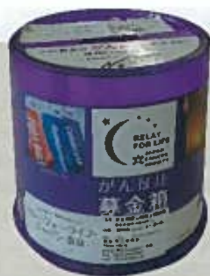
(順不同:2016年9月15日現在)

マミー美容室・喫茶 居酒屋「のん」・奈良県レクリエーション協会・ローソン市立奈良病院店・美容室Objスタイル天理・おやまと・一般社団法人奈良県薬剤師会奈良会営薬局・アクサ生命奈良営業所・アクサ生命大和高田分室・ケイジャン中華ケイズ・(有)オフィス広岡・尾崎事務所・ほほ笑み・NPO法人アクティブシニアライフ協会・大阪エコライフ地球温暖化対策地域協議会・学校法人冬木学園 畿央大学・奈良女子大学附属中等教育学校・エスニック食堂ChatChak・Locco・グランソール奈良